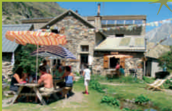
Refuge de La Lavey

N'hésitez pas à vous renseigner auprès des gardiens de refuge, offices de tourisme et bureaux des guides.